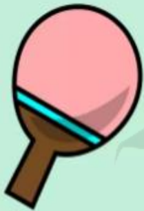
le tennis de table