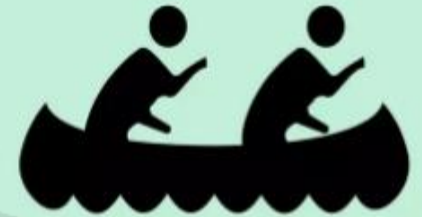
le canoë- kayak