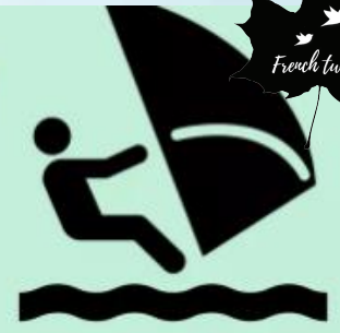
la planche à voile

JOUER AU / À LA / À L' / AUX + NOM FAIRE DU / DE LA / DE L' / DES + NOM