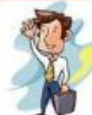
employé (de ~)